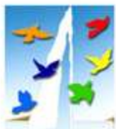
ica general assembly geneva 2009

ICA 2009 General Assembly was an historic event - Dame Pauline Green was elected ICA President and became ICA's first woman president. ICA members also elected the ICA global Board, approved ICA Rules & Bye-Laws amendments and adopted resolutions on the co-operatives and the economic crisis, sustainable energy, climate